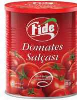
1 KG Domates Salçası

Briks: 28/30 Net Ağırlık: 700 GR Koli İçi Adedi: 12