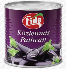
3 KG Közlenmiş Patlıcan