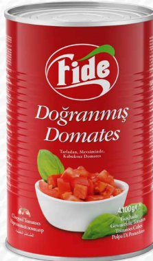
5 KG Doğranmış Domates