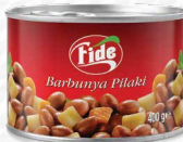
400 GR Barbunya Pilaki