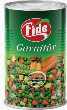
5 KG Garnitür