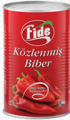
5 KG Közlenmiş Kırmızı Biber