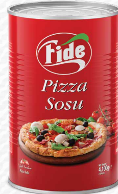
5 KG Pizza Sosu