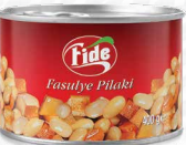
400 GR Fasulye Pilaki