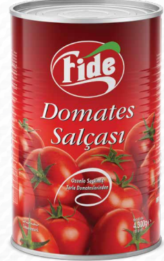
5 KG Domates Salçası

Briks: 28/30 Net Ağırlık: 830 GR Koli İçi Adedi: 12