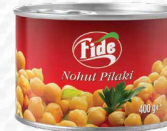
400 GR Nohut Pilaki