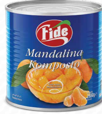
3 KG Mandalina Komposto