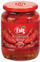
720 CC Közlenmiş Kırmızı Biber