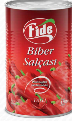
5 KG Biber Salçası Tatlı / Acı

Brix: 20/22 Net Ağırlık: 800 GR Koli İçi Adedi: 12