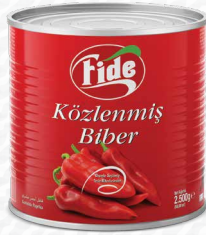
3 KG Közlenmiş Kırmızı Biber