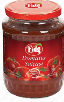
720 CC Domates Salçası

Briks: 28/30 Net Ağırlık: 400 GR Koli İçi Adedi: 24