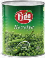
1 KG Bezelye