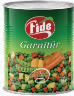
1 KG Garnitür