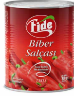
1 KG Biber Salçası Tatlı / Acı

Brix: 20/22 Net Ağırlık: 650 GR Koli İçi Adedi: 12