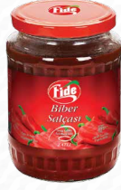
720 CC Biber Salçası Tatlı / Acı

Brix: 20/22 Net Ağırlık: 650 GR Koli İçi Adedi: 12